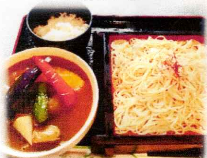
チキンと野菜のカレーつけ